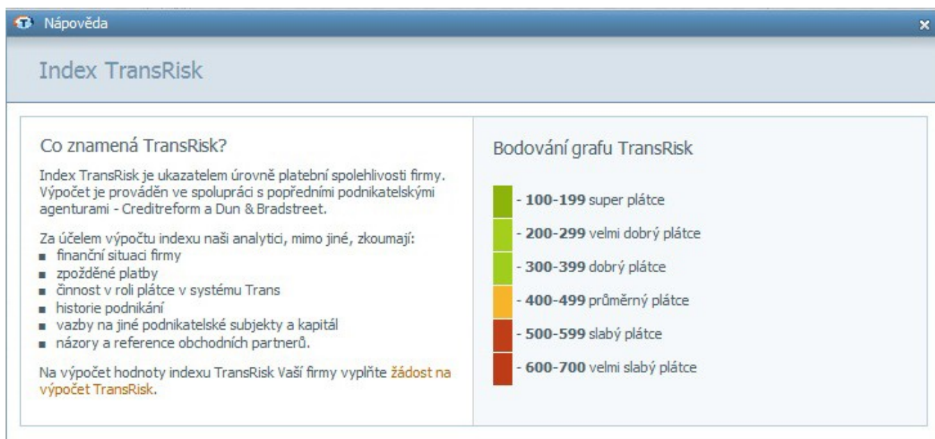
Foto 1. Vlevo - podmínky, na základě, kterých se mění statut Trans Risk. Vpravo - názvy statutů podle bodů.

Trans Risk je ukazatel udělován firmám, které nabízejí volné náklady. Díky němu se může dopravce, který používá dopravní databázi, snadno a rychle rozhodnout, zda se vyplatí vzít objednávku přepravy od konkrétního obchodního partnera a jak velké riziko to znamená. Jak ukazují zkušenosti, pro dopravce je důležitým prvkem ověření platební spolehlivosti odběratele. Na druhé straně firmy zadávající náklad, mohou pomocí indexu zvýšit svou důvěryhodnost a přesvědčit ke spolupráci více dopravců.